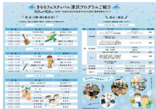
▲きららフェスティバル深沢のパンフレット