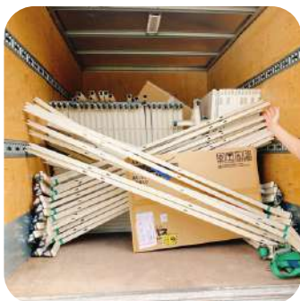
トラックに詰め込んで、