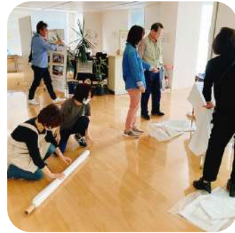
細やかな作業も 並行して行います