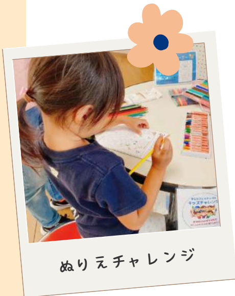
ぬりえチャレンジ