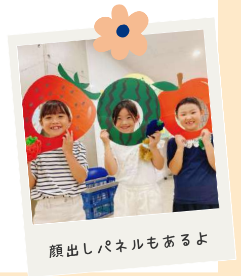
顔出しパネルもあるよ