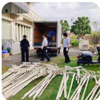
まずは荷物を運び出し🚚

フェスティバルの会場づくりの作業は実は前日から始まっています！ まず、スタッフは深沢学習センターから展示で使用するパネルをトラックで運び、パネル本体とパネルの足を組み立てて、備品の準備をすすめます。