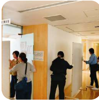
パネルや机を移動する 力仕事もあります👊